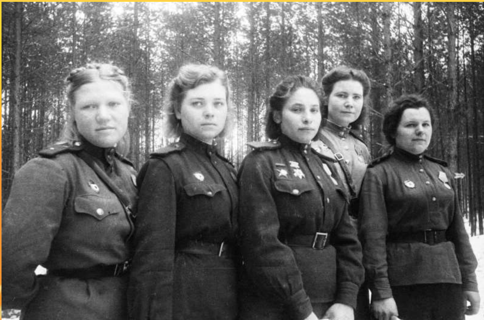
Девушки-санинструкторы 6-й гвардейской армии.