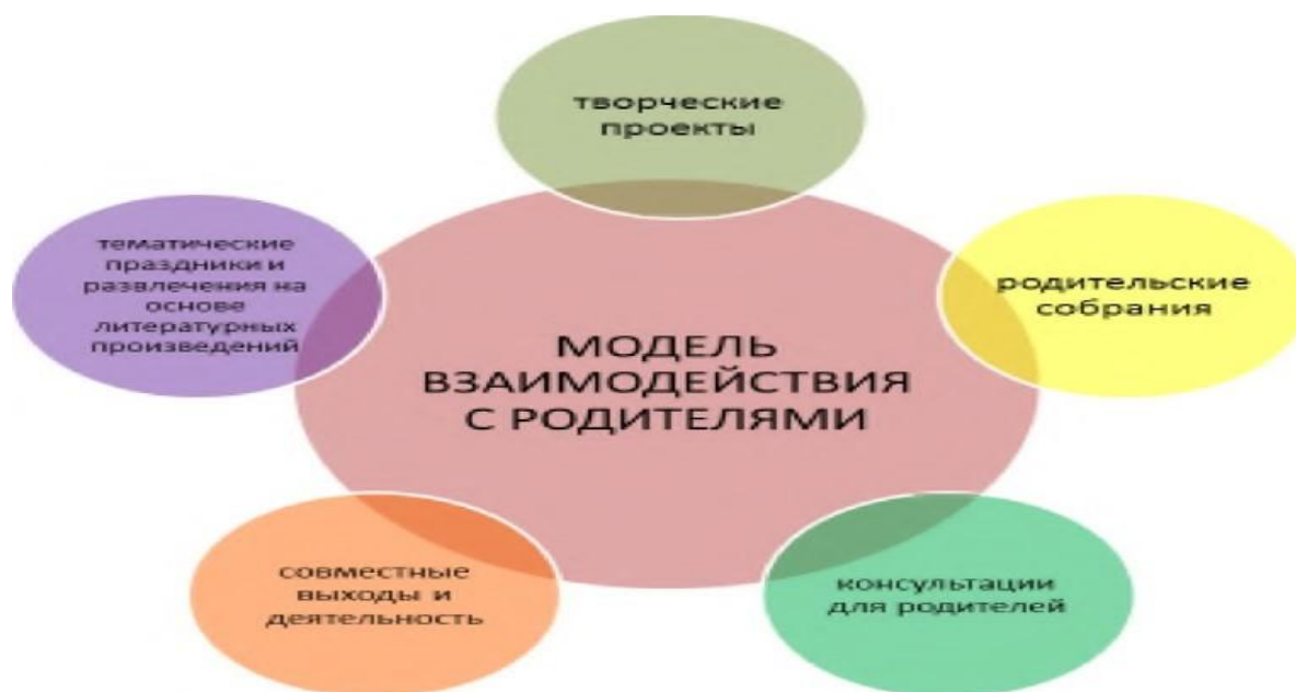
Схема. Модель взаимодействия с родителями.

Взаимодействие с родителями коллектив МБДОУ- детский сад № 31 строит в соответствии с принципом сотрудничества, как с субъектами образовательного процесса. При этом педагогическим коллективом ставятся и решаются следующие приоритетные задачи: